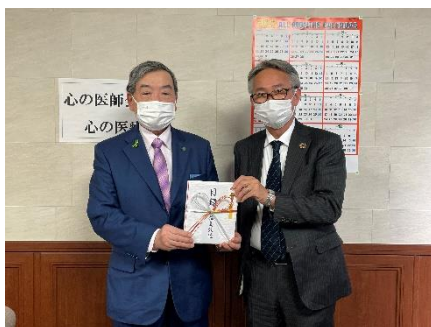
【写真】2023年3月1日 福島県医師会への寄付

県民の高血圧予防・改善に役立ててもらうため、協賛金の一部を日本高血圧学会・福島県医師会・福島県看護協会に寄付しました。